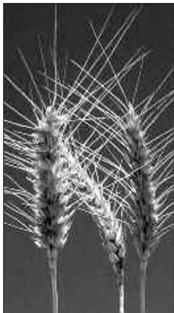
Los precios de los principales cereales siguen siendo elevados, dice la FAO.

"Para millones de personas en los países en desarrollo,