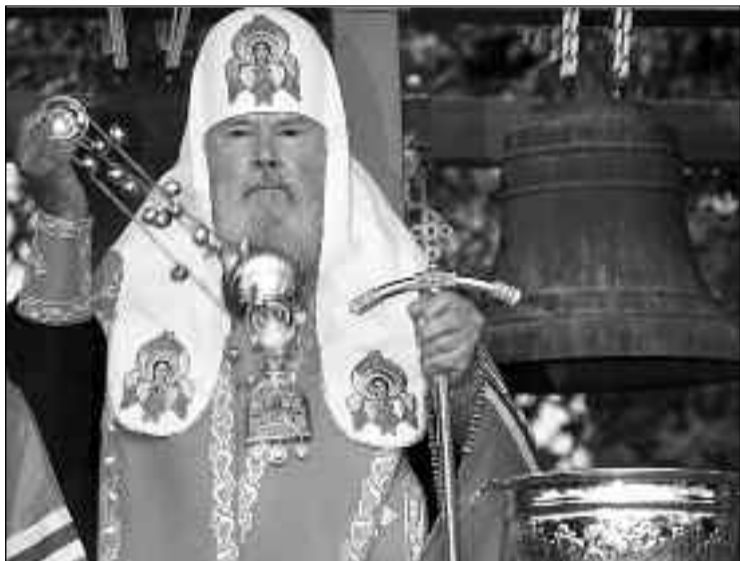
El líder de los cristianos ortodoxos rusos ha fallecido a los 79 años en Moscú.

A comienzos de diciembre, siete vietnamitas católicos que protestaron por este motivo fueron condenados a penas de entre 12 y 15 meses de arresto domiciliario y a dos años de libertad condicional.