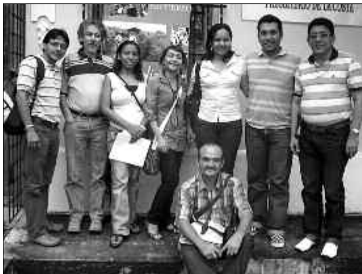
Participantes del encuentro en Barranquilla.

Por otra parte para el encuentro Vida Sexual VIH, se acordó que se llevará a cabo en marzo del 2009 en la sede del prestibero, el evento lo asesorará la Universidad Reformada con su programa Psicología y serán los jóvenes los que lo conducirán, quienes tendrán una reunión previa en este mes para configurar en detalle el programa.