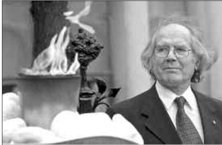
Adolfo Pérez Esquivel.

Esquivel recuerda al secretario acerca de una carta enviada en septiembre pasado, que fue ignorada, en que lo alertaba sobre las terribles violaciones a los derechos humanos provocadas por los mega-emprendimientos mineros. En esta carta, él pedía el cierre preventivo de las actividades de Minera Alumbra Ltda., el rechazo del informe de impacto ambiental de la empresa Minera Agua Rica, y la anulación del proyecto de explotación de uranio en Tinogasta.