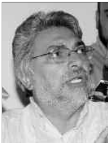
Lugo prometió estudiar a fondo la posibilidad de impugnar sus compromisos financieros.

Así, Brasil, que utilizó el 97% de la electricidad de la represa tendría que pagar US$19.000 millones, mientras que Paraguay, que sólo usó el restante 3% de