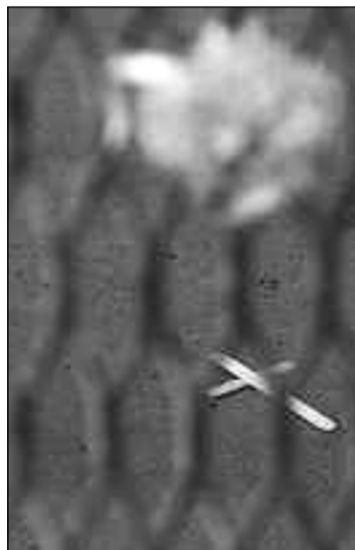
Se calcula que más de 8.000 cadáveres son repatriados cada año desde EE.UU.

Las empresas del sector se niegan a dar cifras de sus ingre-