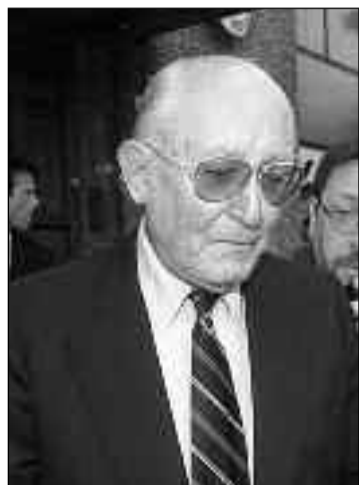
General Santiago Riveros, Comandante de Institutos Militares en Campo de Mayo entre 1975 y 1978.

peruana en las últimas décadas ha experimentado un notable crecimiento en su membresía, y es el Concilio Nacional Evangélico del Perú su institución más representativa. Según Víctor Arroyo, alrededor de mil pastores y líderes evangélicos fueron asesinados y desaparecidos durante el tiempo de la violencia política, y es en memoria de ellos y de todas las víctimas del terror que su institución rechaza propuestas de impunidad, que son carentes de ética y desnaturalizan el sentido real de la reconciliación.