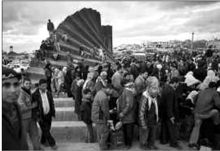
Miles de palestinos atraviesan la Franja de Gaza a Egipto después que una valla en el cruce fronterizo de Rafah fue derrocado. Israel ordenó el cierre de sus cruces fronterizos a Gaza, detener todos los envíos a excepción de los suministros de emergencia, después de un sostenido e intenso bombardeo de cohetes contra Israel por grupos militantes en la Franja de Gaza, controlada por Hamas.

"El Consejo Latinoamericano de Iglesias une su voz a todos y todas que dicen que en esa situación no hay otra cosa que decir que -YA BASTA. No hay ninguna posibilidad de justificar ese tipo de agresión militar sobre una de las regiones más densamente pobladas de la Tierra y queremos pedir a usted a que las Naciones Unidas empujen todos sus esfuerzos para lograr algún tipo de intervención diplomática que pueda ser aceptada por ambas partes, o al menos que ninguna de ellas pueda rechazar" concluye la carta.