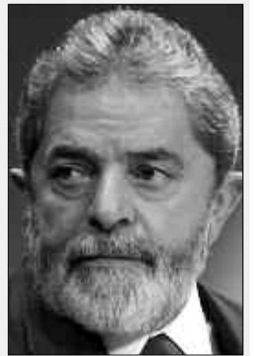
Luiz Inácio Lula da Silva.

BRASIL, que pretende ser un interlocutor de prestigio y de peso en los foros internacionales, cuenta por primera vez con un ambicioso Plan de Cambio Climático, considerado por los analistas mucho más avanzado que el Protocolo de Kioto. Es la primera vez que el Gobierno de Luiz Inácio Lula da Silva ha decidido, con la movilización de 18 ministerios, elaborar un proyecto de defensa del medio ambiente para disminuir drásticamente la emisión de CO 2 , principal gas causante del efecto invernadero.