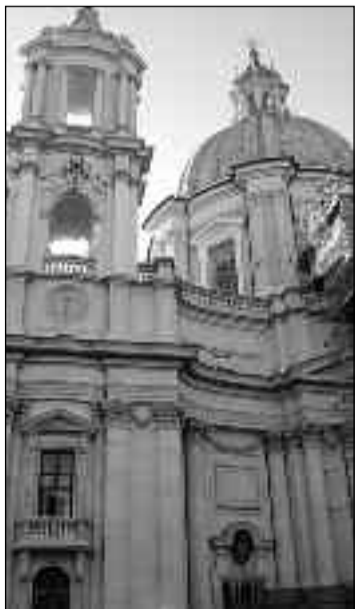
Iglesia de San Pablo en Tarso.

Subrayó que las pláticas se realizaron en la casa de la finada, sin embargo para permitir que la mujer fuera sepultada en el panteón, los católicos exigían que el cuerpo fuera llevado primero a la iglesia del pueblo.