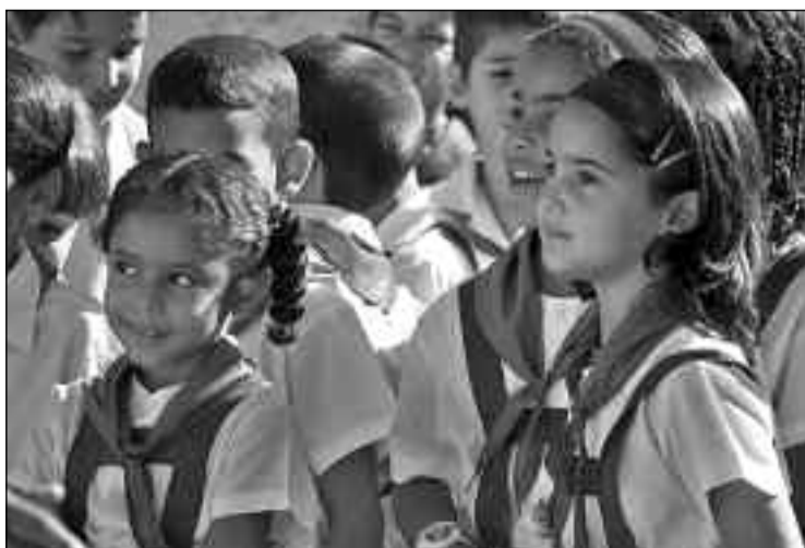
La educación y la salud pública son las cartas de presentación de la Revolución cubana.

Lo que pase en el futuro con la Revolución cubana estará muy ligado a su capacidad de transformarse a sí misma.