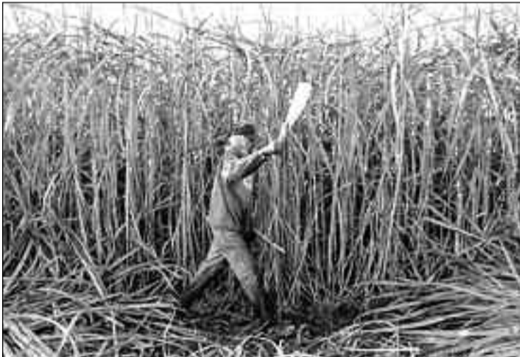
Brasil el mayor productor de etanol en el mundo, la recolección de caña en Brasil es históricamente un empleo degradante y mal pagado.

"Sin tomar en cuenta este costo, no es posible disertar sobre las ventajas comparativas del azúcar y del etanol brasileño en el mercado global", señaló la Pastoral acerca del tono de la Conferencia de Sao Paulo.