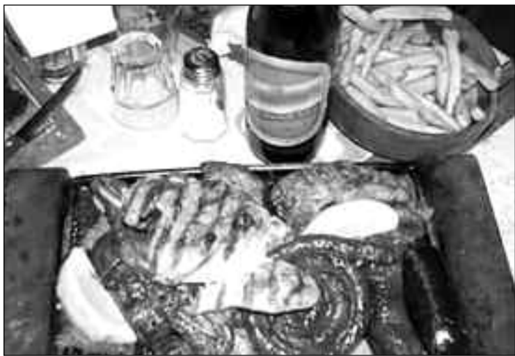
Un 63% de la población consume unas 100 calorías más en cada comida debido a la variante del gen FTO.