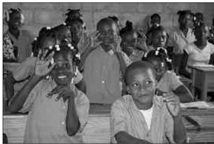
Sus padres los envían a la familia de acogida con la esperanza de que reciban una alimentación y asistencia adecuadas.