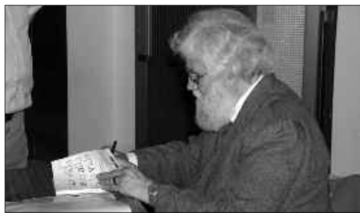
Leonardo Boff cumplió 70 años el 14 de diciembre pasado, fiesta de San Juan de la Cruz.

alternativa que reate los vínculos que fueron rotos entre el ser humano y sus semejantes y entre la humanidad y la naturaleza, de la que somos expresión y plenitud. "La teología de la liberación debe asumir, en el discurso ecológico, la nueva cosmología, la visión que entiende la Tierra como un superorganismo vivo articulado con el entero universo en cosmogénesis", propone.