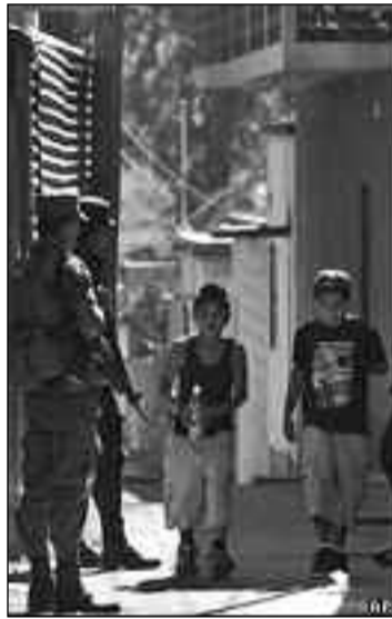
Guatemala ya tiene altos índices de violencia por la influencia del crimen organizado.

"En algunos casos, los narcotraficantes ofrecen un buen pago por las tierras", asegura Zúñiga. "Pero si la respuesta de los propietarios es negativa, los