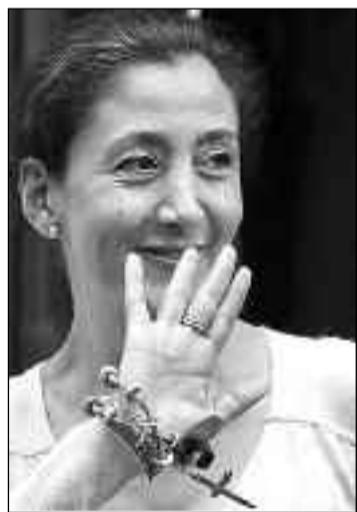
Muchos ex cautivos, como Ingrid Betancourt, agradecieron el papel de Hoyos en su programa.

Y otros ex cautivos del grupo de "canjeables" de las FARC, como Ingrid Betancourt y Luis