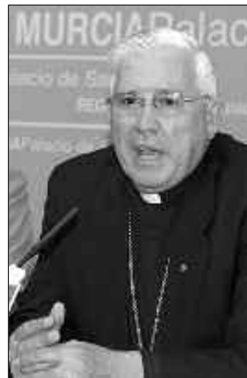
Cardenal Julio Terrazas.

Navarro dijo que la Iglesia "ha construido una relación con el poder con el estado boliviano, reconocida y aceptada por el