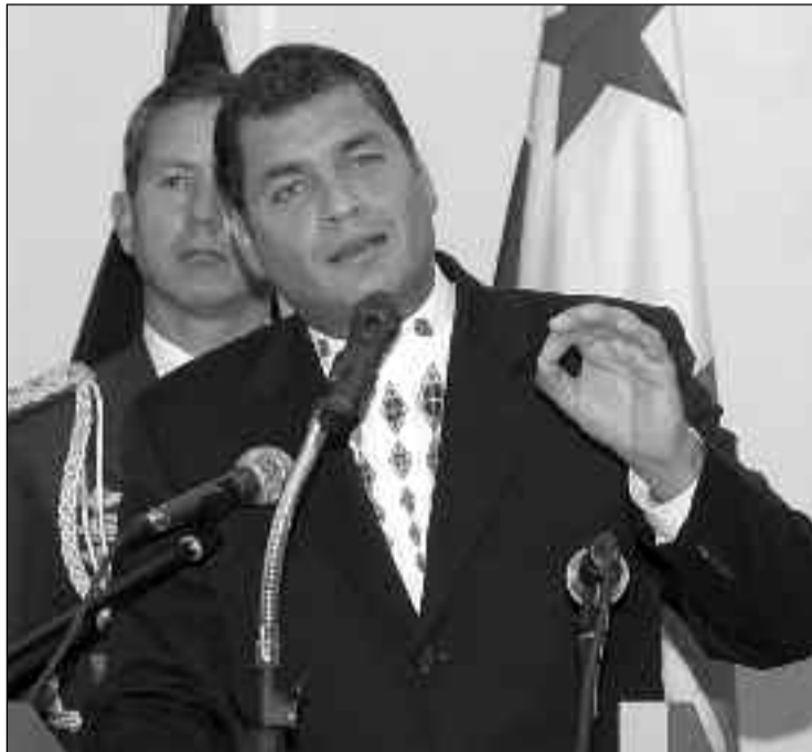
Para algunos analistas esta decisión podría traer consecuencias graves al país.

Ecuador recibió el informe de la Comisión para la Auditoría Integral del Crédito Público (CAIC) que investigó los pasivos internacionales del país en los últimos 30 años. La institución catalogó parte de la deuda que contrajeron gobiernos anteriores como ilegítima o efectuada ilegalmente, por haber violado leyes nacionales e internacionales. La fiscalía iniciará una inves-