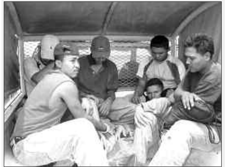
Más de 700.000 inmigrantes fueron detenidos y 386 fallecieron en EEUU durante 2008.

Después de todo, los que mueren en Estados Unidos son parte de esa fuerza de trabajo que solo el año pasado mandó más de US$2.300 millones en remesas a México.