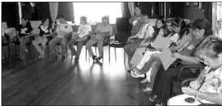
En Paraguay el CLAI y el UNFPA realizarán talleres sobre salud sexual y reproductiva.

Del encuentro participaron miembros de las iglesias nucleadas en el CLAI en Paraguay como Discípulos de Cristo, Misión de Amistad, iglesia Evangélica del Río de la Plata y el CIPAE.