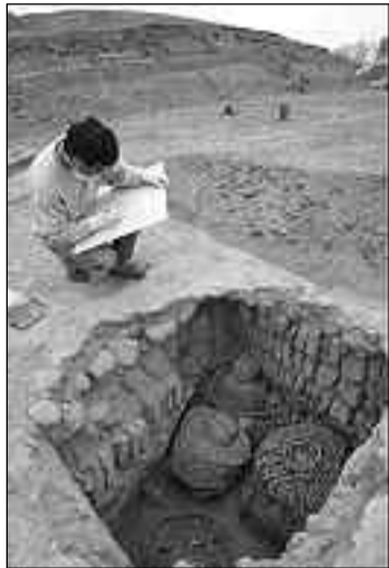
A comienzos de 2008 se habían hallado tumbas wari en el centro de Lima.

Los investigadores afirman que en la ciudadela enterrada se hallaron celdas y evidencia de sacrificios humanos, donde los restos de las víctimas eran arrojados al océano Pacífico