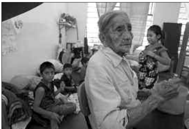
El Estado se encarga de velar por el bienestar de la población y asistirle en situaciones de riesgo, como en la temporada de huracanes.

El 100% de los niños y adolescentes van a la escuela, que es efectivamente obligatoria hasta noveno grado, y sigue sin costar ni un centavo hasta el nivel universitario, donde son gratuitos hasta