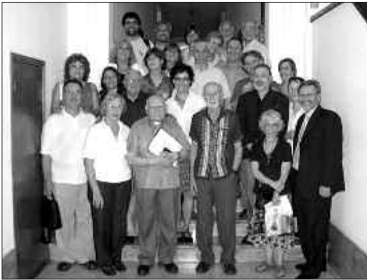
Líderes ecuménicos celebran los 30 años del CLAI en Buenos Aires.