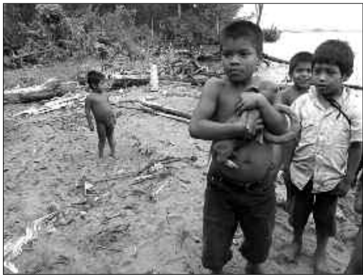
Según la FAO, 51 millones pasaron hambre en América Latina y el Caribe en 2008.

Osmar- Actualmente estos emprendimientos tienen el cuello de botella, la zona de mayor dificultad, en la comercialización y en la producción con calidad, porque es difícil competir con las grandes iniciativas del mercado. Éstas, por ejemplo, logran divulgar sus productos en medios masivos de comunicación, algo que en el caso de los emprendimientos solidarios, costaría mucho más que la producción. Pienso que los gobiernos podrían privilegiar estas iniciativas solidarias con las compras gubernamentales, siempre obedeciendo a criterios de calidad.